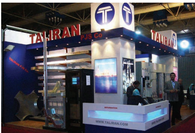
هشتمین نمایشگاه بین المللی صنعت برق ایران ۱۳۸۶ - 8th IEE 2007