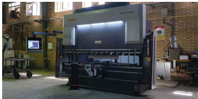
CNC Hydraulic Bending Machine