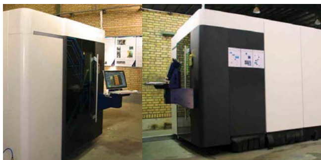
CNC Laser Cutting Machine