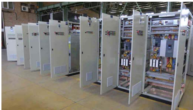
MCC Panel with VFD & Soft Starter