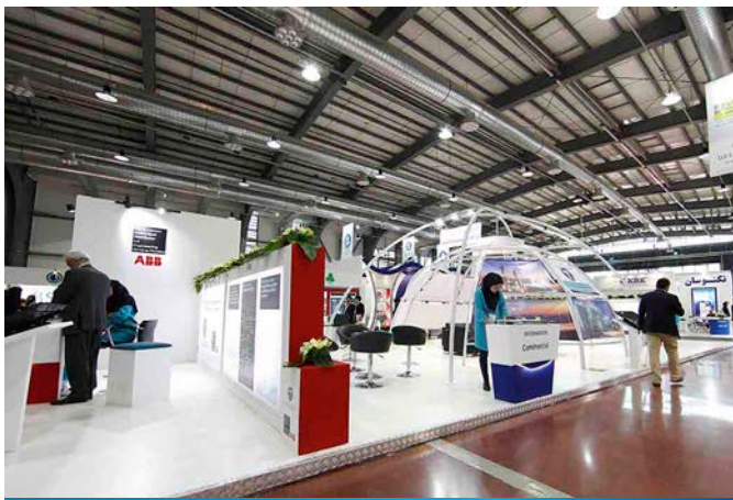
هفدهمین نمایشگاه بین المللی صنعت برق ایران ۱۳۹۶ - 17th IEE 2017