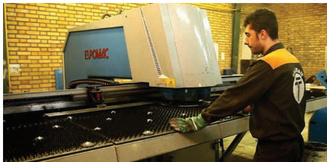
CNC Hydraulic Punching Machine