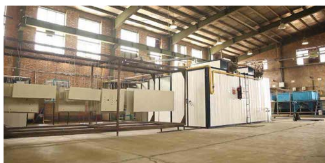
Powder Coating System