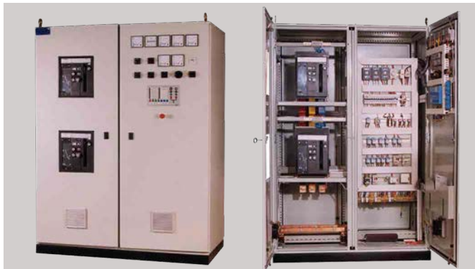
Diesel Generator Change Over and Control Panel