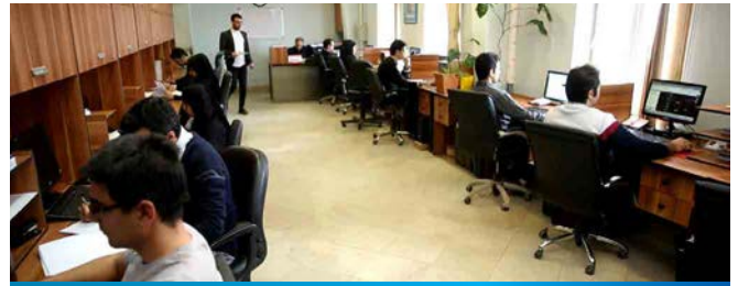
Factory (Technical Department)