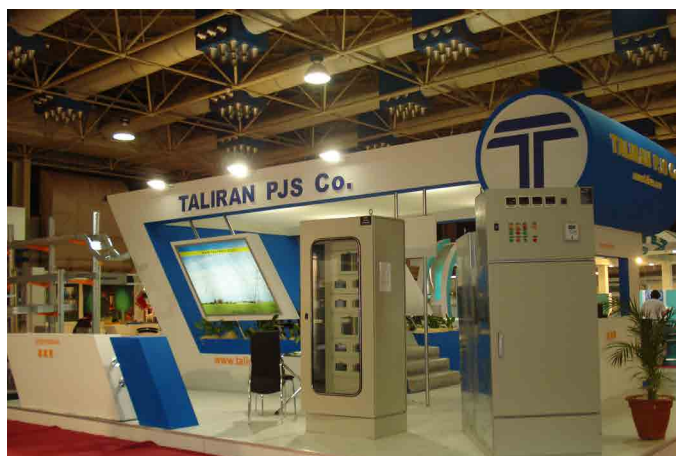
دهمین نمایشگاه بین المللی صنعت برق ایران ۱۳۸۸ - 10th IEE 2009