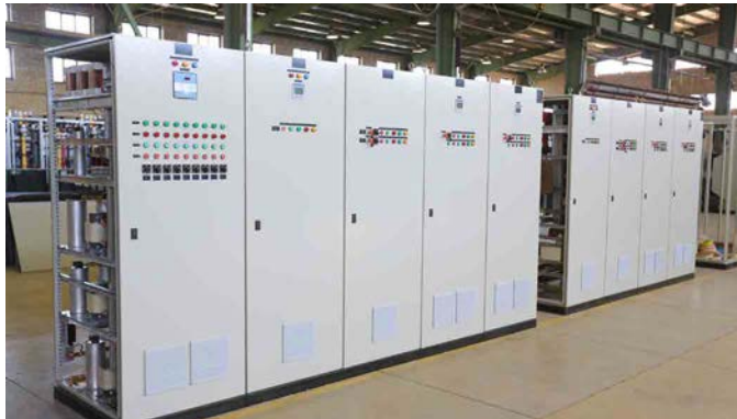
LV Capacitor Bank