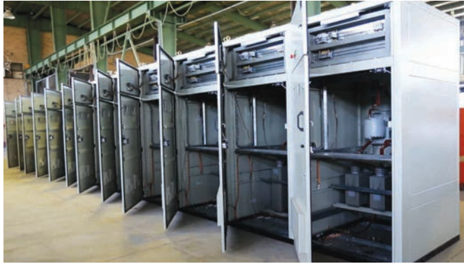
MV Capacitor Bank