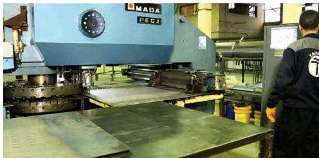
CNC Hydraulic Punching Machine