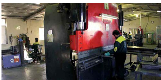
NC Hydraulic Bending Machine