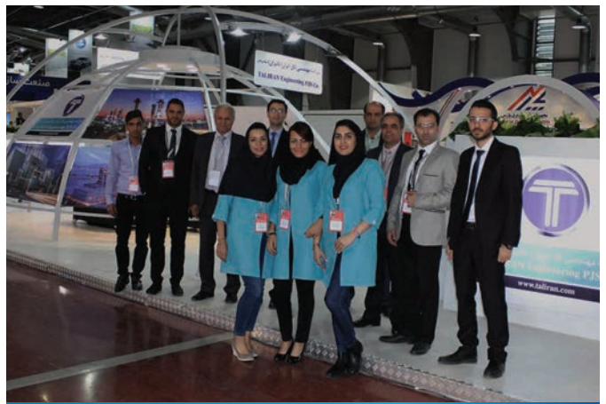
هفدهمین نمایشگاه بین المللی صنعت برق ایران ۱۳۹۶ - 17th IEE 2017