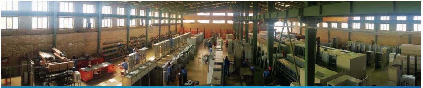
Factory - Internal view of assembling unit