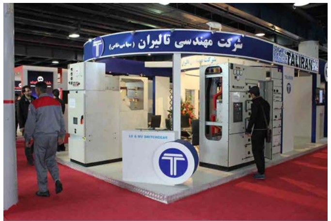
پانزدهمین نمایشگاه بین المللی صنعت برق ایران ۱۳۹۴ - 15th IEE 2015