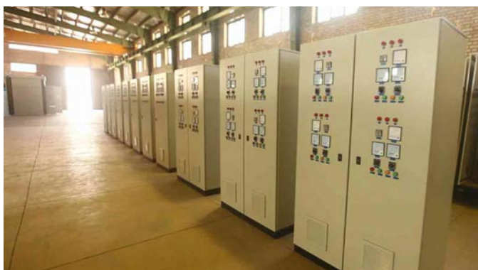
Thyristor Controlled HVAC System