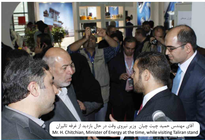
آقای مهندس حمید چیت چیان وزیر نیروی وقت در حال بازدید از غرفه تالیران Mr. H. Chitchian, Minister of Energy at the time, while visiting Taliran stand