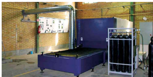
CNC Laser Cutting Machine